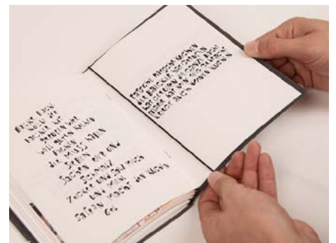
⑫ ... unten ebenso und zum Schluß noch justieren.