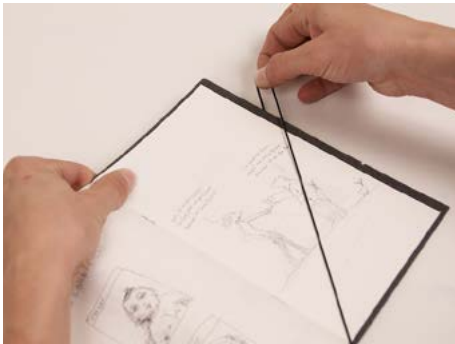
④ bis er nicht mehr unter Spannung steht