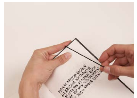
⑨ Heft und Umschlag oben gut festhalten und das Gummi nach unten aufziehen.