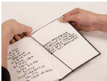
⑪ Oben den Gummi bis in die dafür vorgesehene Absenkung im Buchrücken ziehen ...