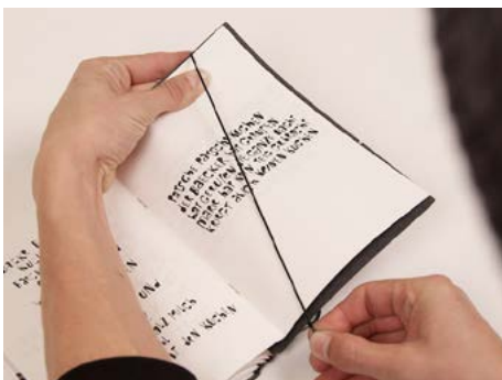
⑩ Den unteren Gummi unten um den Umschlag ziehen.