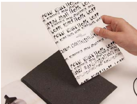
⑦ Das neue Heft einlegen.