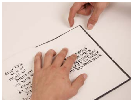
⑧ In der Heftmitte aufschlagen. Dabei muss das Heft vollständig im Umschlag liegen.