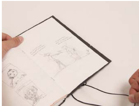
⑤... und das Heft freigibt.