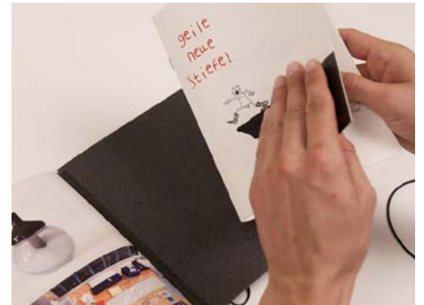
⑥ Das alte Heft herausnehmen.