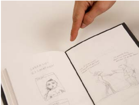
① Heft beim Gummi in der Mitte aufschlagen